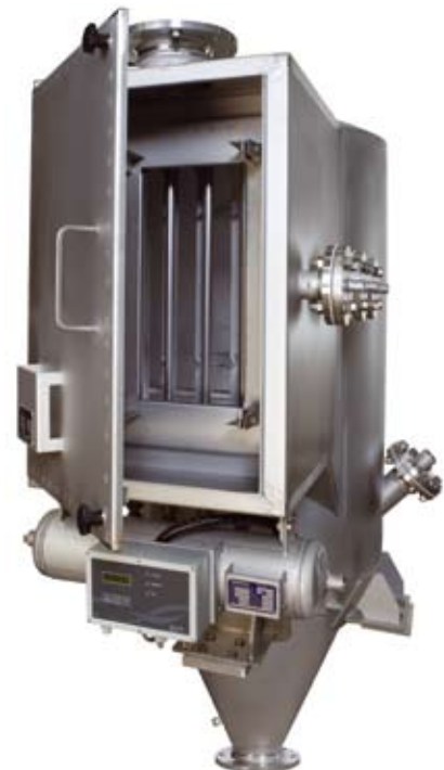
Totalabscheider mit 2-stufiger Filtration